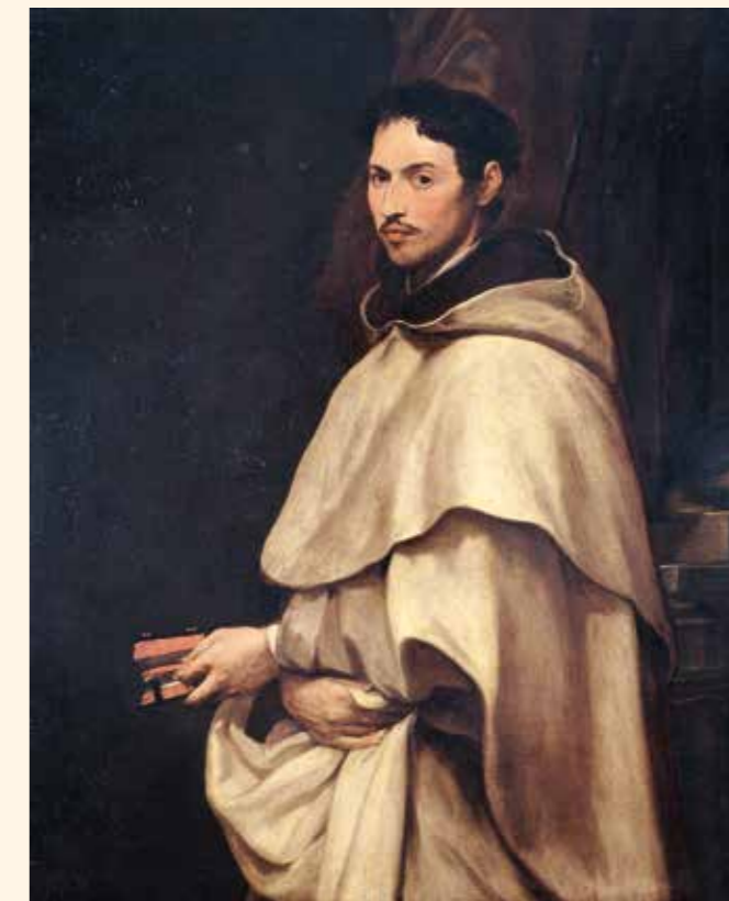
Anthonis van Dyck (1599-1641) (zugeschrieben) Bildnis eines Dominikaners

Städtische Galerie in der Reithalle Paderborn-Schloß Neuhaus