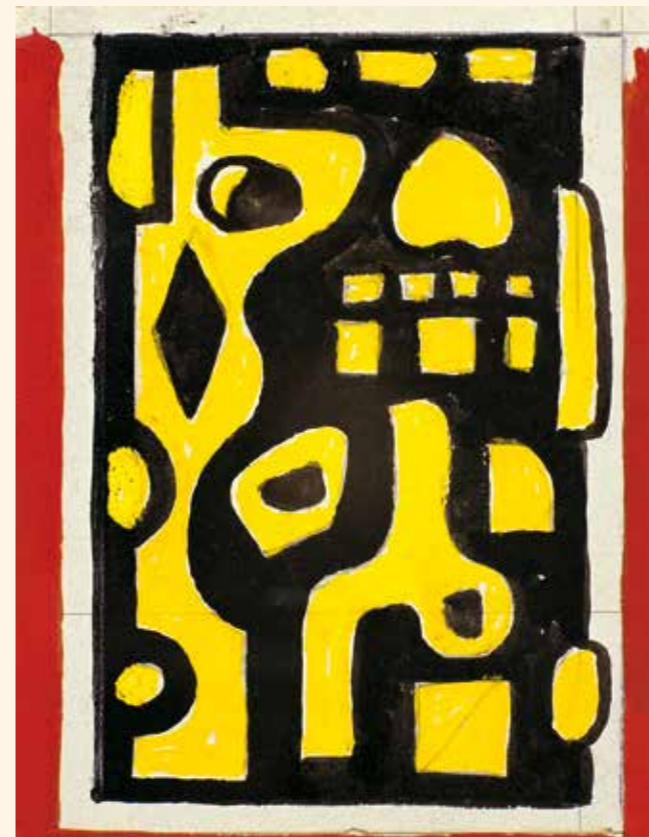
Fernand Léger Komposition in Gelb und Schwarz , 1937

Die Ausstellung in der Reithalle verdankt sich einer Kooperation mit dem Kreis Paderborn, dem Freundeskreis Mantua e.V. und der großzügigen Leihgabe der Ca' la Ghironda. – Die Werkschau mit annähernd 90 Gemälden und Mischtechniken wird im Anschluss an Paderborn im Kunstmuseum Bayreuth gezeigt werden.