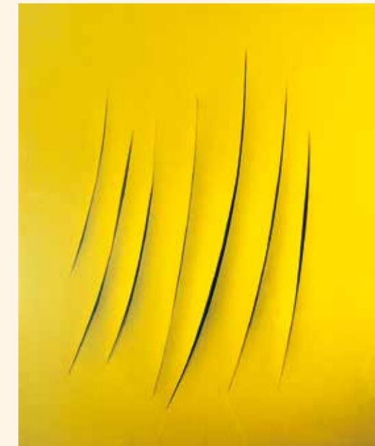
Lucio Fontana Concetto Spaziale (Raumkonzept) , 1962