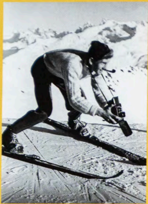
Ski-Rollei-Davos, o. J.