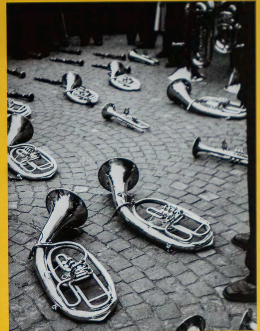
o. T., 1945

Karussell-Abstractions (Abb. li.), 1947 Magie der Schiene (Abb. re.), 1949