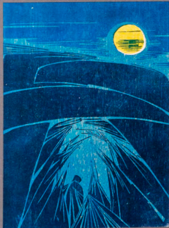
In der Not 1977 Farbholzschnitt

Viele Reisen in den Norden, wie auch in die Wüste, haben mir Eindrücke vermittelt, die mein Interesse dahin richteten, die Gesetzmäßigkeiten der Natur, selbst in kleinsten Ausschnitten, zu sehen und festzuhalten. Diese in eigenständigen Arbeiten, in einem vorgegebenen Rahmen, in unterschiedlichen Techniken, neu entstehen zu lassen.