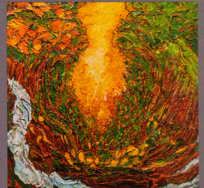
Schöpfungsgeschichte. Gott schuf den Menschen als sein Abbild, als Mann und Frau. Er gab ihnen die Erde als Unterpfand, die Erde zu hegen und zu pflegen. Er gab sie ihnen als Aufgabe. Er herrschte über Tiere und Erde 2015-16, Acryl, Öl /Lw.