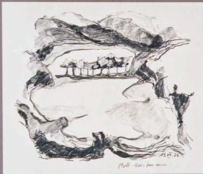
Bergsee (Norwegen) 1976, Zeichnung

KUNSTMUSEUM IM MARSTALL PADERBORN-SCHLOSS NEUHAUS