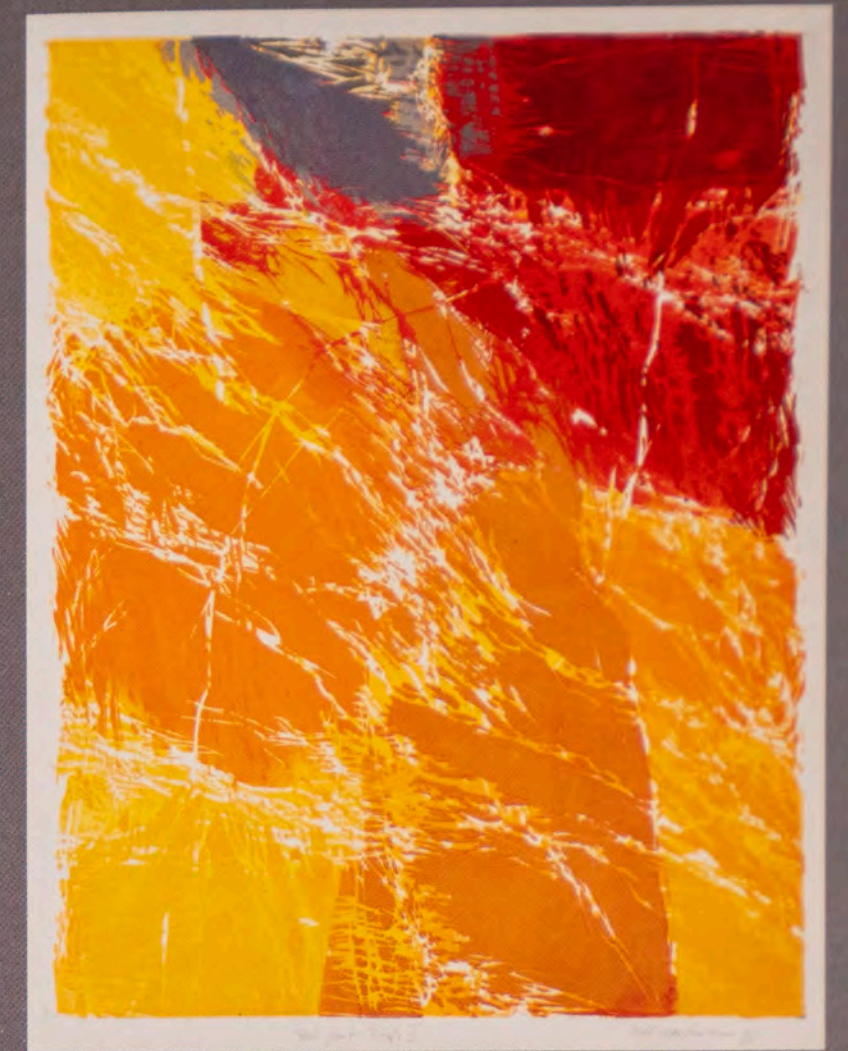
Rot - Glut - Fluss 1995, Farbholzschnitt

Die Künstlerin sammelt auf Spaziergängen, langen Reisen oder auf Autofahrten Landschaftseindrücke, die ihr zuteil werden als verinnerlichte Bilder. Diese verarbeitet sie dann künstlerisch zumeist in ihrem Atelier. Landschaftselemente werden zu zeichenhaften Formen und Sinnbildern. Moll-Horstmanns Landschaften zeugen von einem reflektierenden Prozess über das in der Natur Gesehene und Erlebte und weisen stets über das sichtbar Gemachte hinaus.